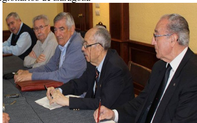
Imagen de la reunión (II)

La reunión forma parte del ciclo anual de encuentros de asociaciones y hermandades, y tuvo lugar a partir de las 12.00 horas, en la residencia Logística Palafox, con la asistencia de las siguientes entidades: