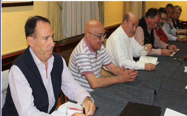
Imagen de la reunión (I)

Real Hermandad de Veteranos de las Fuerzas Armadas y de la Guardia Civil