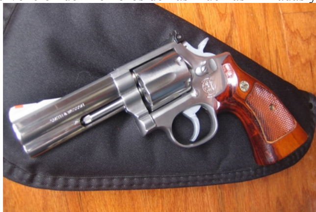
Revólver Smith-Wesson 686

Pese a ello nunca se les ha detenido ni arrestado, es más, con cierta frecuencia han obtenido premios y recompensas por sus acciones, de manos de organizaciones civiles y en ocasiones también de instituciones oficiales.