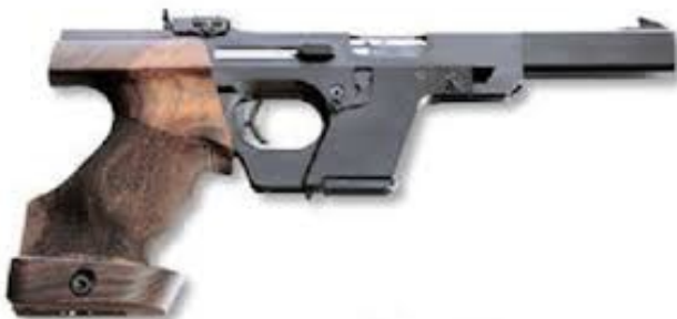
Pistola Walther GSP

Bueno, queridos amigos, no se alarmen porque les aseguro que no les estamos refiriendo ninguna crónica negra.