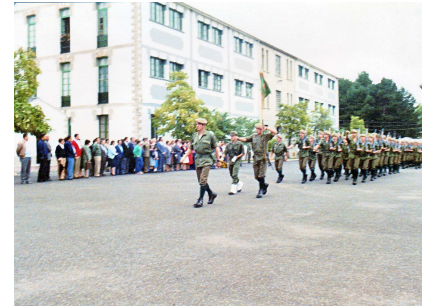
Loa Veteranos de Verga en el Palacio de la Aljaferia año 1985

el recuerdo de los varios años que estuvieron haciendo el servicio militar en Berga. El Furriel, el Escribiente, el encargado de armamento, todos los que al menos allí estaban, pues no eran todos por muy diversos motivos, recuerdan y me contaban, cientos de anécdotas, de aquella época y de las reuniones que a lo largo de los años iban teniendo, primero solos y posteriormente con los hijos y ahora con los nietos. Al año siguiente la reunión fue en Zaragoza a la que fui invitado, y pase un día muy agradable. Creo que es muy aleccionador.