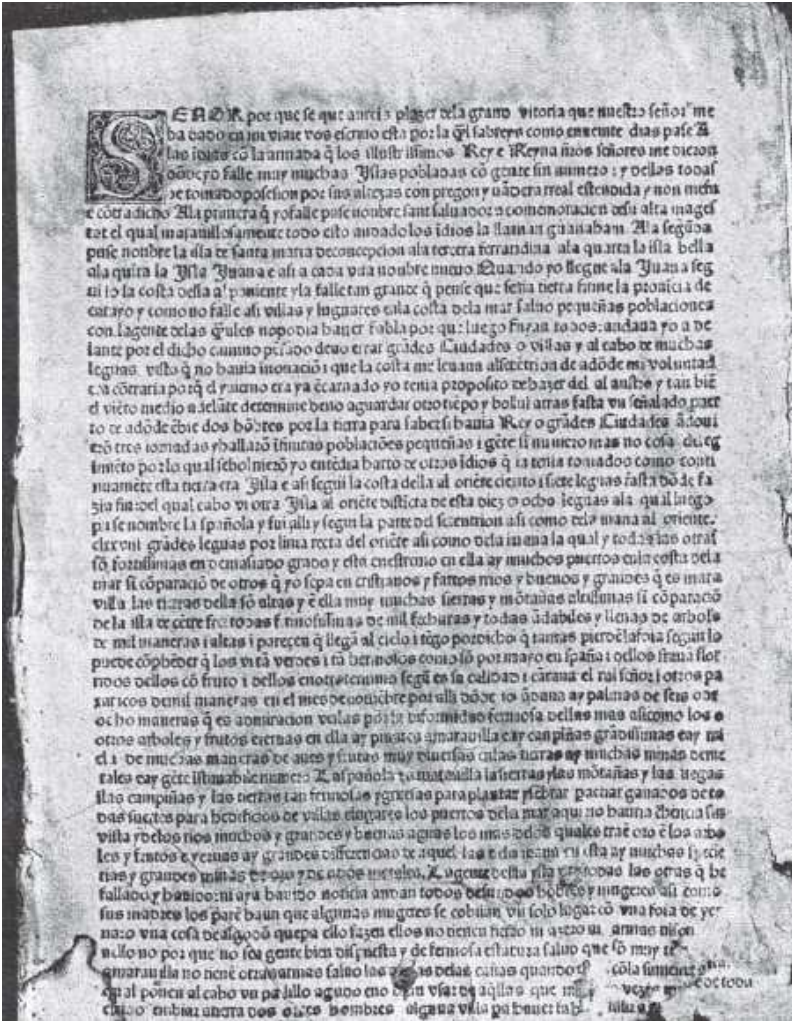
Ilustración de la edición de Basilea en 1.494

Primera página en facsímil de la Carta, impresa en el taller de Pere Posa, en Barcelona en 1.493