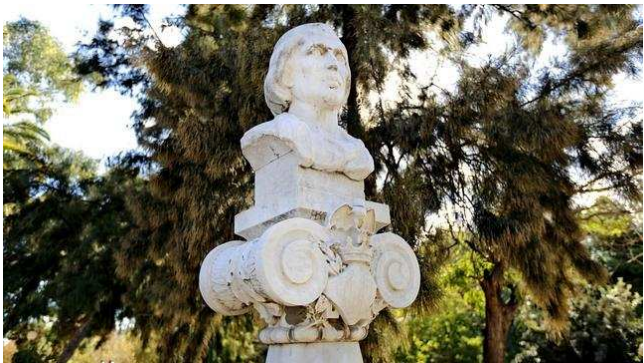
Busto de Luis de Santángel en la Alameda de Valencia, en el que se puede leer: «A Luis de Santángel. Generoso cooperador del descubrimiento de América. La ciudad de Valencia. MCMXXI.»